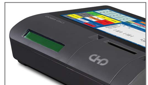
Ecran client deux lignes

Microsoft, Windows, Intel and Realtek are trademarks of their respective owners. All other trademarks are the property of their respective owners.